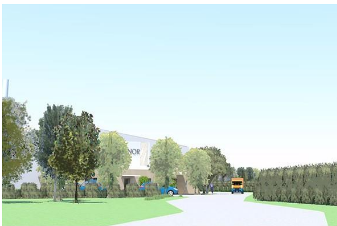
Laurent, présentée par la Société JEFERCO.

Après débat et vote à l'unanimité, le Conseil Municipal donne un avis favorable sur la demande d'autorisation d'exploiter de l'unité de fabrication de granulés bois et une centrale bio-masse sur la Zone Industrielle Saint